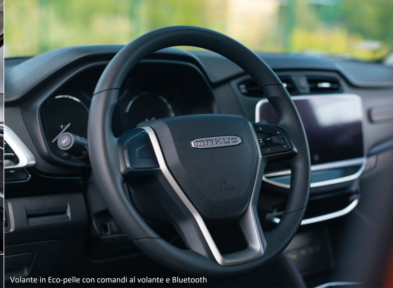
Volante in Eco-pelle con comandi al volante e Bluetooth