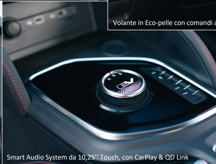
Smart Audio System da 10,25" Touch, con CarPlay & QD Link