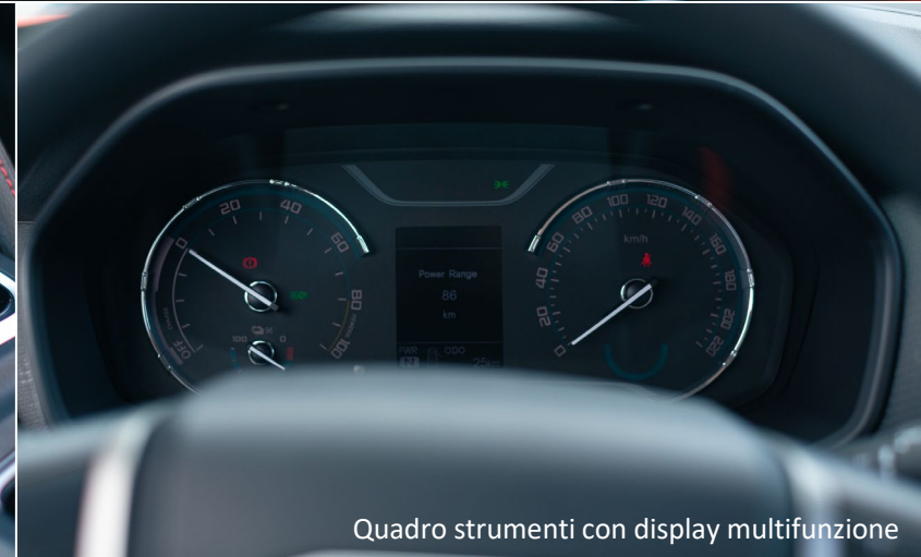
Quadro strumenti con display multifunzione