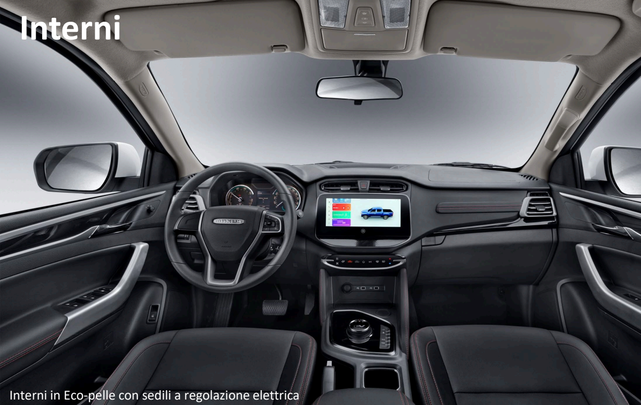
Interni in Eco-pelle con sedili a regolazione elettrica