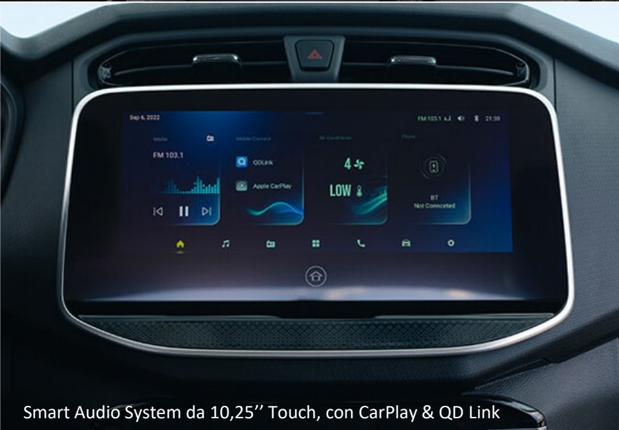
Smart Audio System da 10,25" Touch, con CarPlay & QD Link